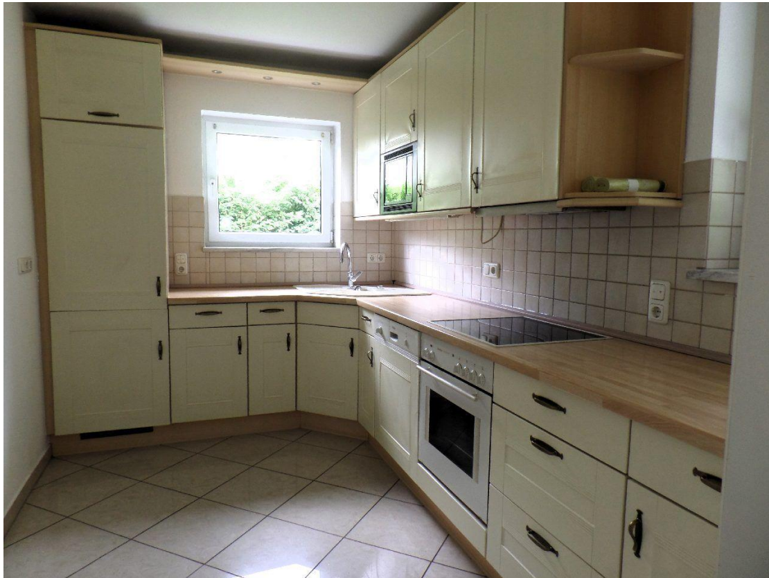
Küche mit EBK