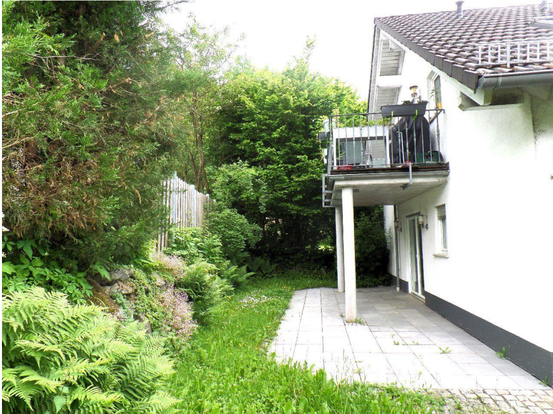
Garten - Terrasse