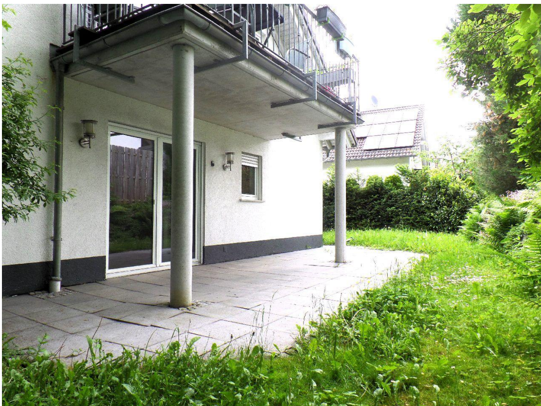
Garten - Terrasse